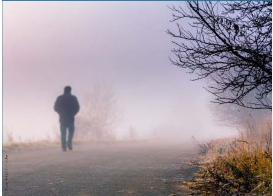
Durch die Abwanderung junger Menschen entsteht in vielen ländlichen Gebieten ein Gefühl der Perspektivlosigkeit.

Aber nicht nur in Deutschland, auch in vielen anderen ländlichen Räumen Mitteleuropas sind durchschnittlich bis